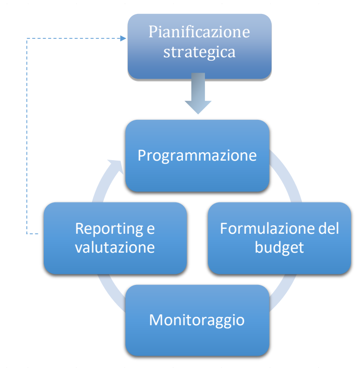
Fig. 2 Il ciclo della performance

A sua volta, il PIAO è il primo tassello del ciclo della performance, che vede tre fasi fondamentali: