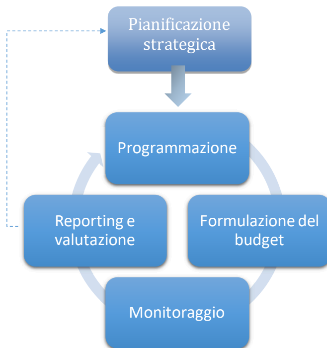
Fig. 1 Il ciclo della performance

In coerenza con il Piano di programmazione triennale, si procede con la redazione del Piano integrato di attività e organizzazione (PIAO), in particolare con la sezione “Valore pubblico e Performance” che sviluppa in chiave sistemica la pianificazione delle attività amministrative in ordine alla performance, in stretto collegamento con le attività connesse alla trasparenza e all’anticorruzione ai sensi della normativa vigente di cui alla terza Sezione “Rischi” del medesimo documento. In particolare nella Sezione 2 del PIAO sono definiti gli obiettivi operativi e i target di riferimento per la valutazione della performance organizzativa e individuale.